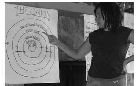
Una miembro de CISPES-Boston dirige un taller durante el campamento

Al final, los meses de planeamiento y logística fueron recompensados con un fin de semana realmente exitoso. Salimos sintiéndonos más personalmente cercanos, más integrados a la organización, mejor equipados para hacer nuestro trabajo, y más comprometidos con el movimiento por la justicia social aquí en los Estados Unidos y, por supuesto, en El Salvador. ■