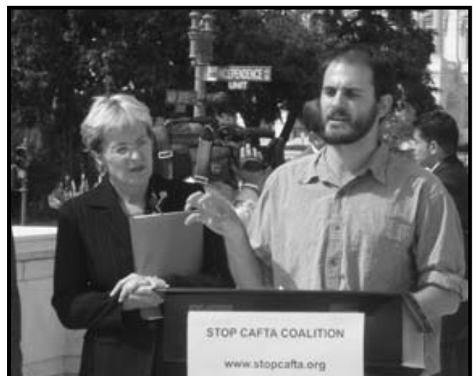
Director de CISPES Burke Stansbury con la Congresista Marcy Kaptur (D-OH) en una conferencia de prensa

Para mayor información, bajar el informe “DR-CAFTA, Año Uno” y leer el Juramento vaya a www.stopcafta.org