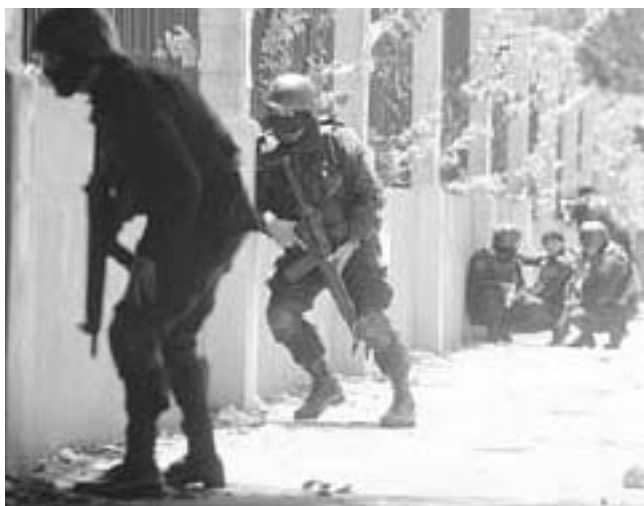
Los policas afuera de la universidad el 5 de Julio

El miércoles 5 de julio un show masivo de la policía – incluyendo la policía antimotines (UMO) y la GRP (un grupo especializado élite de la policía) y francotiradores en las azoteas del Hospital Bloom – fueron ubicados en la entrada principal de la Universidad de El Salvador (UES) en espera de una marcha estudiantil protestando contra el incremento en la tarifa del transporte urbano. Cuando la UMO capturó violentamente a dos estudiantes de 15 años de edad (de quienes por lo menos uno fue transportado más tarde a un hospital debido a la grave golpiza) los otros estudiantes respondieron lanzando piedras contra la policía. Esta última comenzó disparando balas de goma y gases lacrimógenos mientras avanzaba ominosamente hacia los estudiantes. Un hombre no identificado que portaba un arma de alto calibre abrió fuego contra la policía. Dos policías antimotines murieron